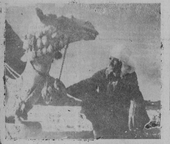
NA ZDJĘCIU: typowy obrazek z pustyni.