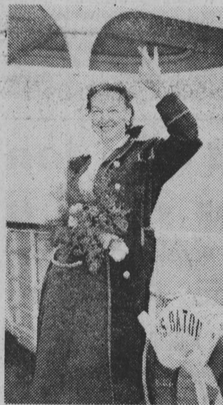
W dniu 29 bm. na pokładzie M/S „Batory” przyjechała w odwiedziny do kraju nasza słynna lekkoatletka Halina Konopacka. Konopacka na Igrzyskach Olimpijskich w 1928 r. w Amsterdamie, zdobyła pierwszy Złoty Medal w historii polskiej lekkoatletyki za najlepszy rzut dyskiem.