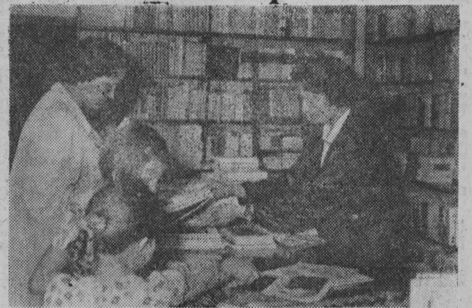
Chociaż rok szkolny rozpocznie się dopiero za miesiąc w białostockich księgarniach można spotkać coraz więcej uczniów kupujących podręczniki szkolne. NA ZDJĘCIU: w księgarni przy Rynku Kościuszki.