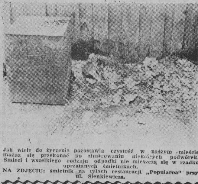
Jak wiele do życzenia pozostawia czystość w naszym mieście można się przekonać po zlustrowaniu niektórych podwretek. Śmieci i wszelkiego rodzaju odpadki nie mieszczą się w rzadko uprzątanym śmietnikach. NA ZDJĘCIU: śmietnik na tyłach restauracji „Popularna” przy ul. Sienkiewicza.