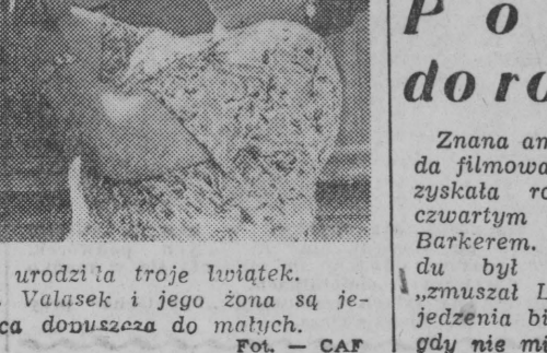
5-letnia lusia Cilina urodziła troje lwiątek.