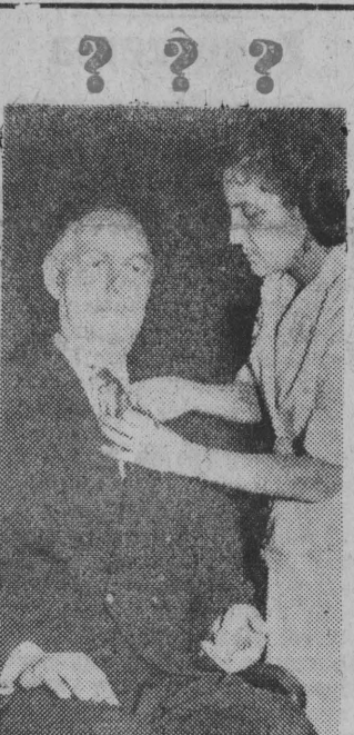
Ależ tak — nie mylicie się. To generał de Gaulle w cywilu i... z wosku. Paryżskiemu Muzeum Grevin przybyła nowa osobistość.

Prowadzona obserwacja nie pozwoliła, ze względu na dużą wysokość przelotu, na rozpoznanie balonów. Istnieje przypuszczenie, iż były to balony meteorologiczne przeprowadzające badania naukowe. (Bo)