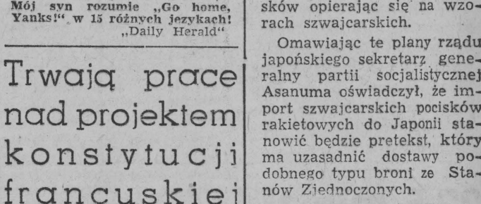
— Jednakże podobał ten... Mój syn rozumie „Go home, Yanks” w 15 różnych językach. „Daily Herald”

MOSKWA (PAP) 28. 7. Jak donoszą z Tokio, rząd japoński nosi się z zamiarem wyposażenia swoich wojsk w nowoczesne rodzaje broni, a zwłaszcza w pociski zdalnie kierowane.