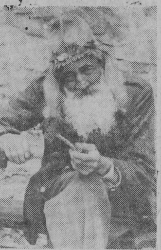
Przy schronisku na Grossglockner (Alpy Austriackie). Pozowaniem turystom do pamiątkowej fotografii starzec ten od lat zarabia na życie.

Proletariusze wszystkich krajów, łączcie się!