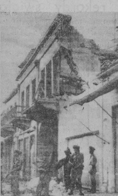
LONDYŃ (PAP) 28. 7.