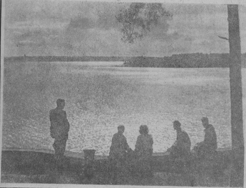
W księżycowej poświacie migoczą fale jeziora Necko.