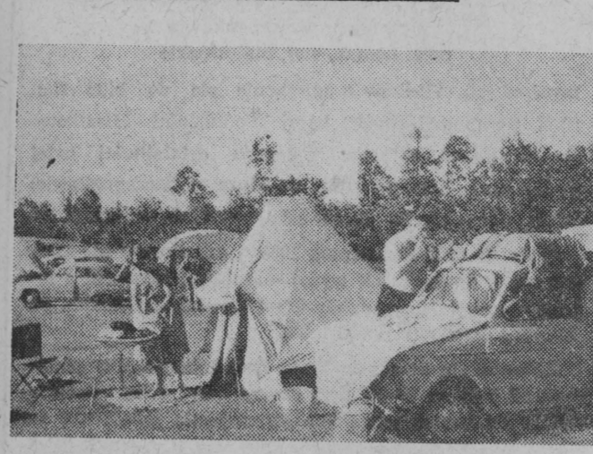
Ania pod Warszawą gościł w nocy z dnia 25 na 26 bm. niecodziennie esportowim do Moskwy rozbiło tu swe namioty. Jest to już trzecia grupa nauzczytel francuskich, jadących do Związku Radzieckiego przez Warszawę. CAF - fot. Dabrowicki

W drodze do Moskwy gościł w nocy z dnia 25 na 26 bm. niecodziennie esportowim do Moskwy rozbiło tu swe namioty. Jest to już trzecia grupa nauzczytel francuskich, jadących do Związku Radzieckiego przez Warszawę. CAF - fot. Dabrowicki