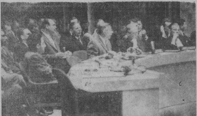
NA ZDJĘCIU: przemawia przedstawiciel ZSRR w ONZ A. Sobolew...