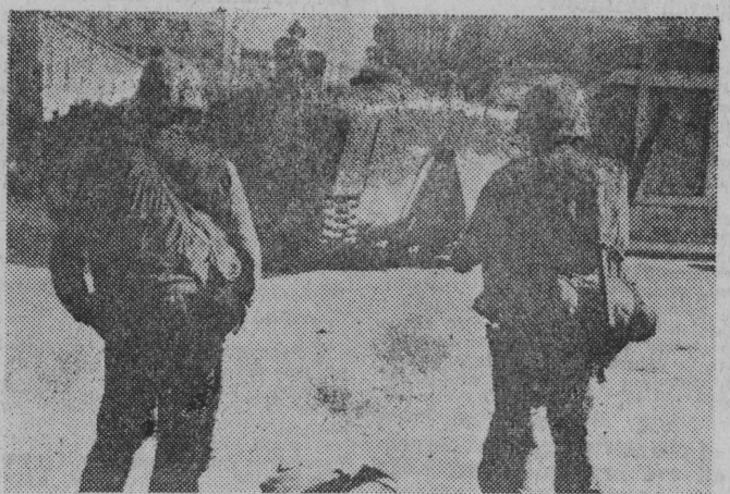
NA ZDJĘCIU: żołnierze amerykańscy na ulicach Bejrutu.