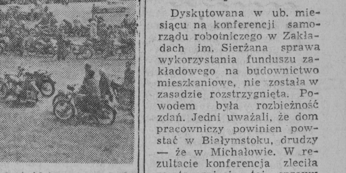
Pierwszy Wielki Motorowy Złot Gniaździasty na polach Grumaldu 12-15 lipca.