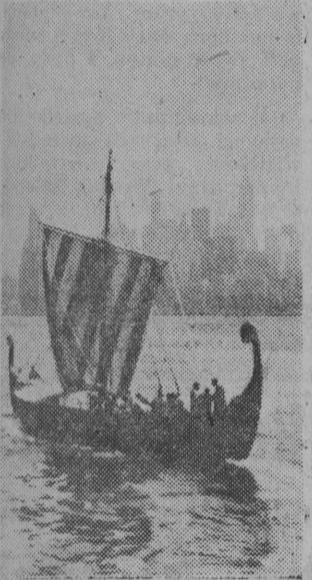
Po 22 dniach podróży przez Atlantyk na statku wzorowanym na łodzi Wikinów siedmiu śmialków z Norwegii przybyło do Nowego Jorku.