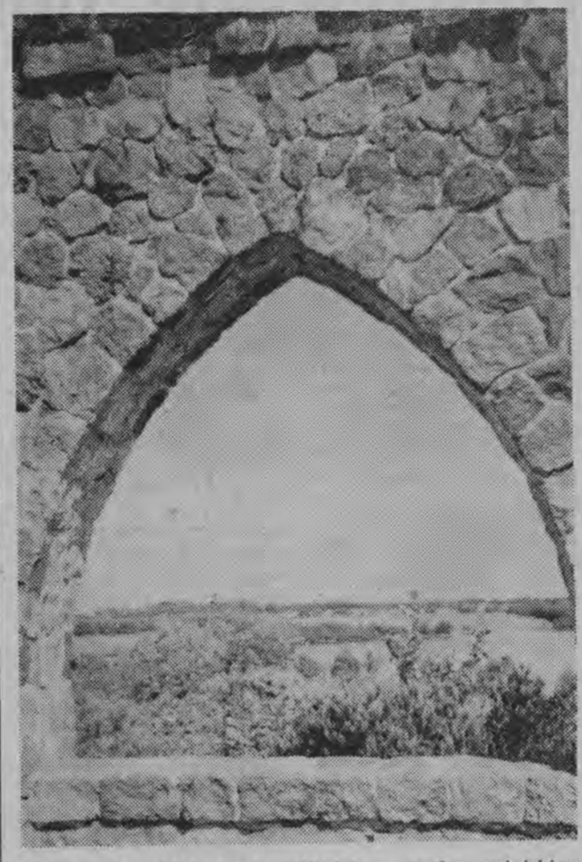
Piękno mazurskiej ziemi — Widok z parku miejskiego w Oleku.