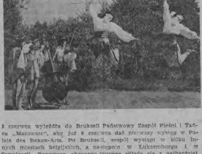
2 czerwca wyjechał do Brukseli Państwowy Zespół Pieśni i Tańca „Mazowsze”. Aby już z czerwca dać pierwszy występ w Pałacu de Beaux-Arts. Po Brukseli, zespół wystąpi w kilku innych miastach belgijskich, a następnie w Luksemburgu i w Szwajcarii.