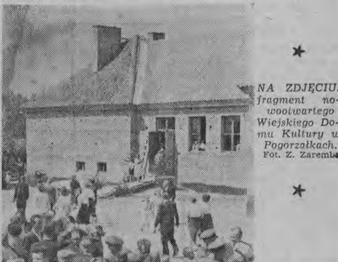
NA ZDJĘCIU: fragment nowootekowanego Wiejskiego Domu Kultury w Pogorzałkach.

Piękna pogoda dopisała uroczystym obchodom Święta Ludowego, jakie odbyły się w dniu wczorajszym w wielu miastach i wsiach naszego województwa. Obchody stały pod znakiem jeszcze większego zacieśniania się więzi między klasą robotniczą a pracującym chłopstwem. Liczne delegacje robotników, przedstawiciele partii, robotnicze zespoły artystyczne były wszędzie owacyjnie witane przez chłopów w dniu ich święta.