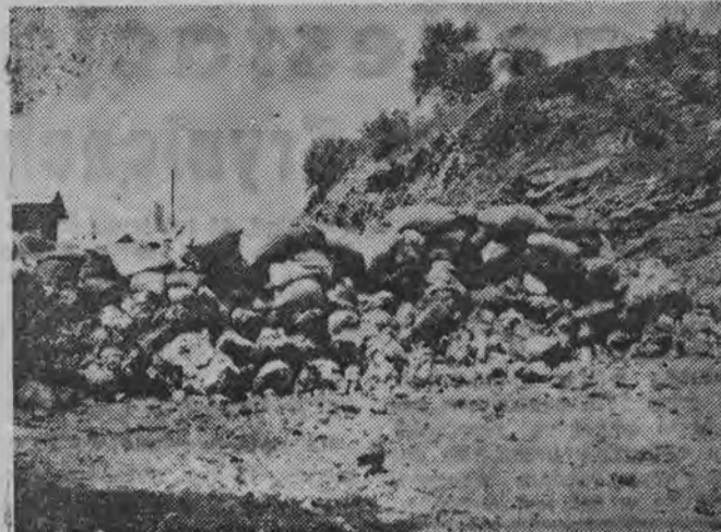
NA ZDJĘCIU: barykada z worków z piaskiem na szosie do Tripolisu.