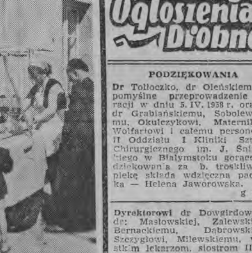
...nie można było chyba in przedw, ochładzając się wodą...