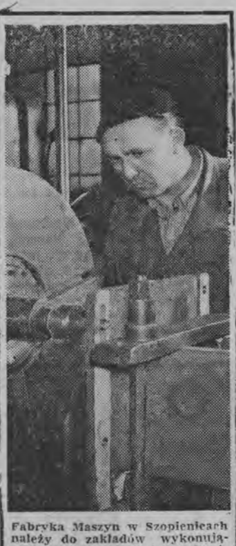
Fabryka maszyn w Sopocie należała do zakładów wyprodukujących systematycznie i w nadwyżce 4 swe misecznicy...