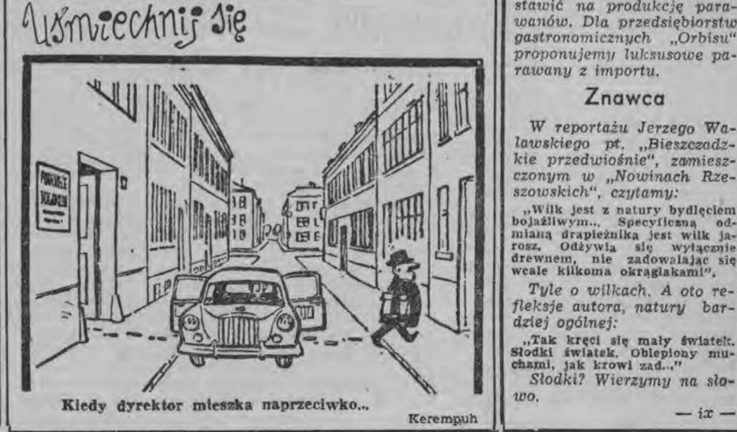
Kiedy dyrektor mieska naprzeciwko... Keempuh

Tyle o wilkach. A oto refleksje autora, natury bardziej ogólnej: „Tak kręci się nalty światek, słodki światek. Oblepiony muchami, jak krowi zad...”