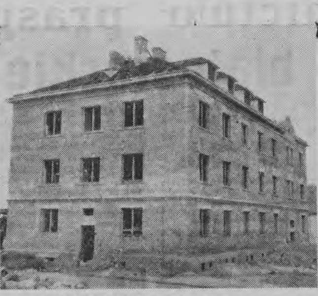
NA ZDJĘCIU: budowa hotelu robotniczego.