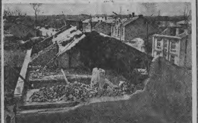
W dniu 15 bm. nad Rawą Mazowiecką i okolicznymi wioskami przeszedł gwałtowny huragan, wyrządzając duże szkody. W akcji pomocy bierze udział wojsko. NA ZDJĘCIU: zniszczone domy w Rawie. (Dalsze zdjęcia — na str. 3)