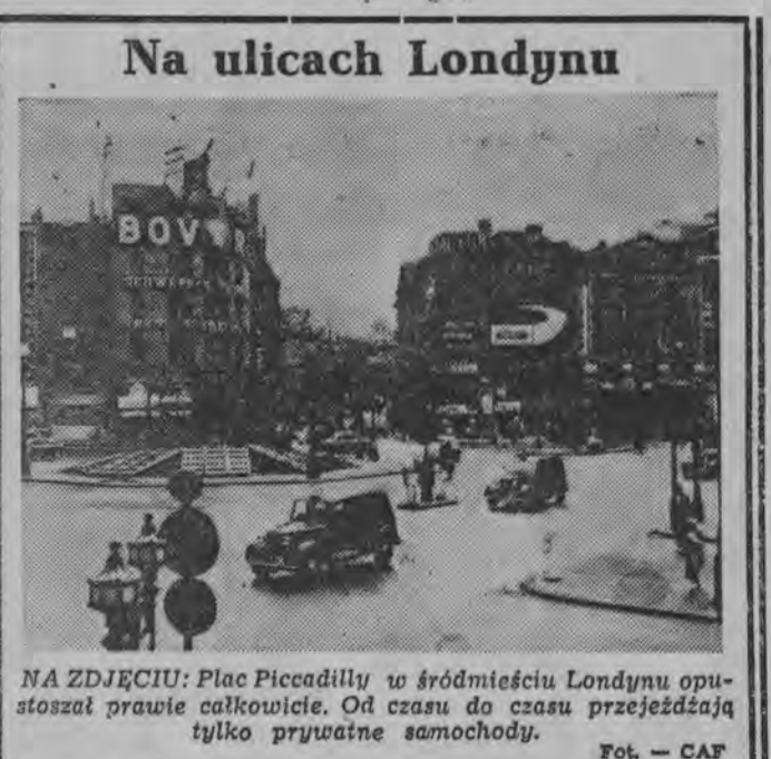
Na ulicach Londynu