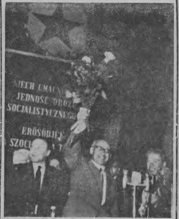
NA ZDJĘCIU: wielki wiec w hali sportowej w Budapeszcie.