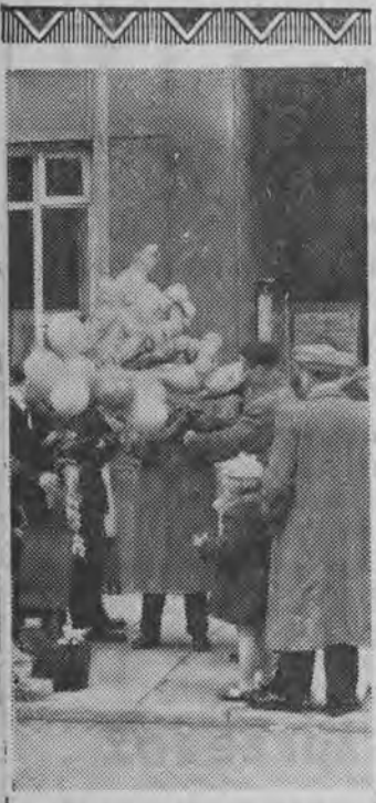
Razem z wiosną na ulicach Białegostoku pojawiły się baloniki.