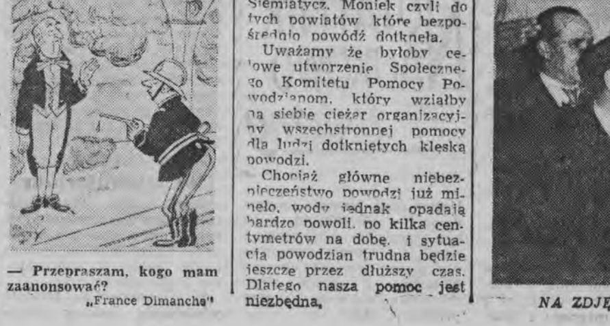
NA ZDJĘCIU: wspólna pogawędka po kolacji.