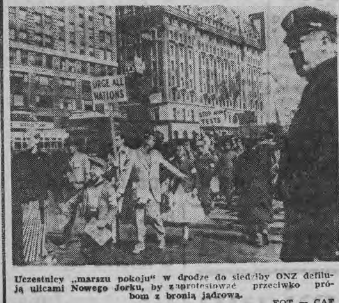
Uczestnicy „marszu pokoju” w drodze do siedziby ONZ...