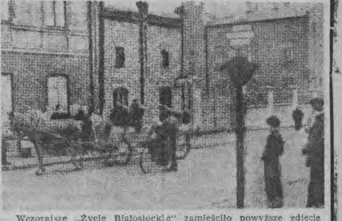
Wczorajsze „Życie Białostockie” zamieściło powyższe zdjęcie opatrzone je nagłówkiem „Przed odjazdem” i dodając następujący podpis: Pociąg przybył. Spokojnie stoi na Dworcu Centralnym w Białymstoku i czeka na podróżnych. Jest ich sporo na peronie, ale na pewno znajdzie się jeszcze dla nich miejsce w przedziałach. Nie wiedzieliśmy, że mamy tak kiepski pociąg. Ciekawe, czy to jest osobowy, czy też express? (G)

Między innymi WKT stara się o wprowadzenie do planu inwestycji Ministerstwa Kolei projektu usprawnienia transportu kolejowego w Białostocczyźnie, na szlakach turystycznych.