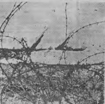
Na terenie bazy lotnictwa amerykańskiego koło Griesheim. Za silnymi zasiekami z drutu kolczastego — rakiety „Nike-Ajax”.

Solingen jest drugim po Dortmundzie miastem w zagłębiu Ruhry, którego ludność zagrażają oddziały rakietowe.