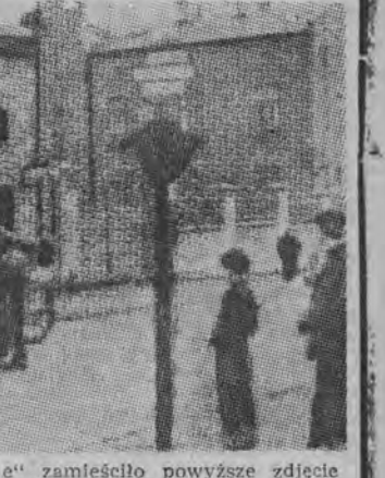
Wczorajsze „Życie Białostockie” zamieściło powyższe zdjęcie opatrzone je nagłówkiem „Przed odjazdem” i dodając następujący podpis: Pociąg przybył. Spokojnie stoi na Dworcu Centralnym w Białymstoku i czeka na podróżnych. Jest ich sporo na peronie, ale na pewno znajdzie się jeszcze dla nich miejsce w przedziałach. Nie wiedzieliśmy, że mamy tak kiepski pociąg. Ciekawe, czy to jest osobowy, czy też express? (G)