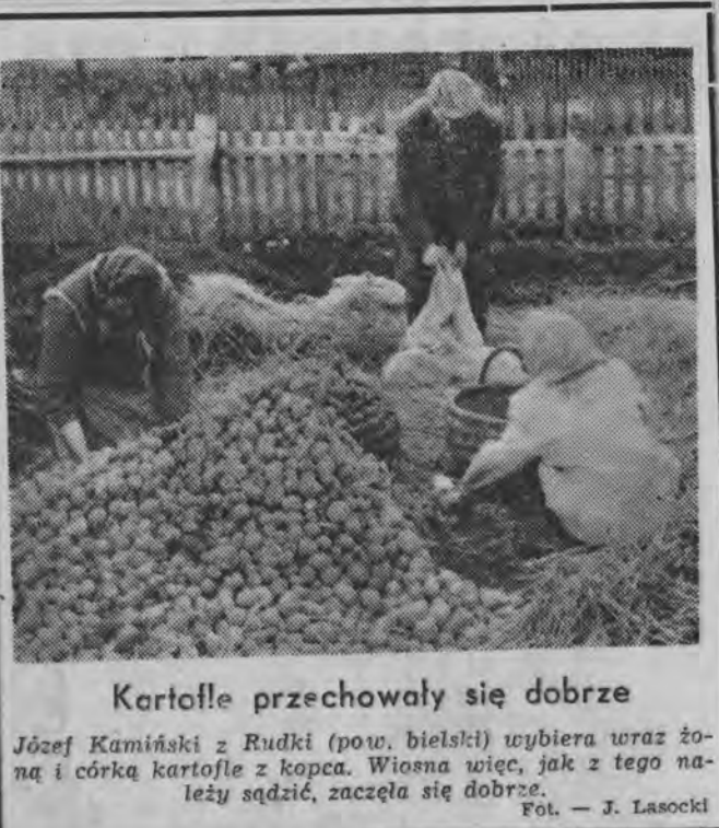
Karofle przechowały się dobrze