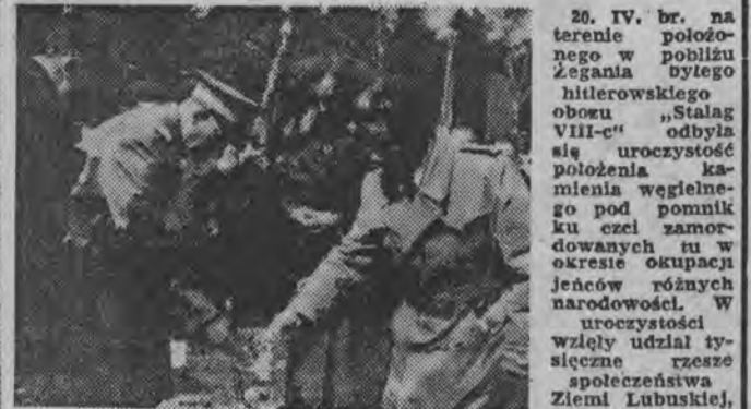
20. IV. br. na terenie położonego w pobliżu Żegania obozu hitlerowskiego...