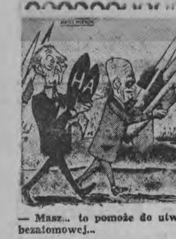
Masz... to pomoże do utworzenia w Europie strefy bezatomowej.

Rozwój i umocnienie owoce współpracy między naszymi krajami we wszystkich dziedzinach życia politycznego, gospodarczego i kulturalnego wzbudzały w narodzie radzieckim uczucie głębokiego zadowolenia. Szerokiego rozmachu, szczególnie w ostatnich latach, nabrały radziecko-polskie stosunki gospodarcze, które kształtują się na gruncie zasady równoprawności, z uwzględnieniem interesów obu państw.