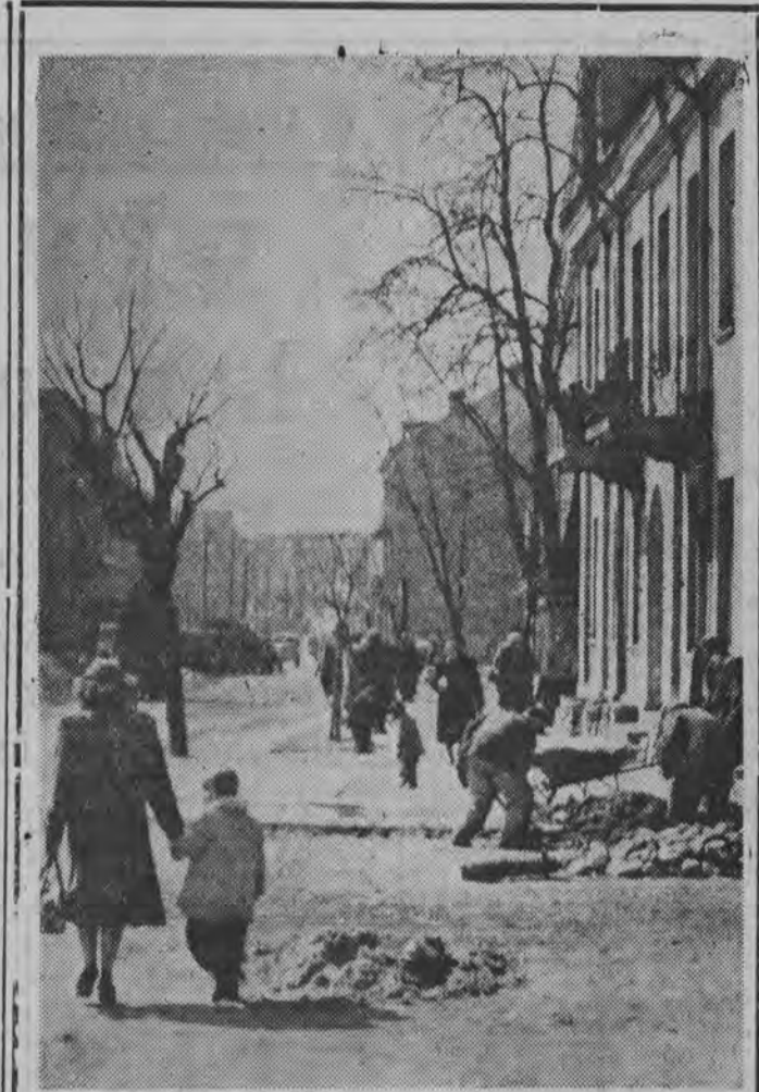
„Zielona Pani“ w Białymstoku... — patrz strona 6

Organizacje robotnicze wspólnie z państwem ludowym muszą tylko dbać o to, aby ten podział był sprawiedliwy, aby każdy, kto bezpośrednio i pośrednio uczestniczy w procesie wytworzenia otrzymał swoją część zgodnie z zasadą, która obowiązuje w socja-