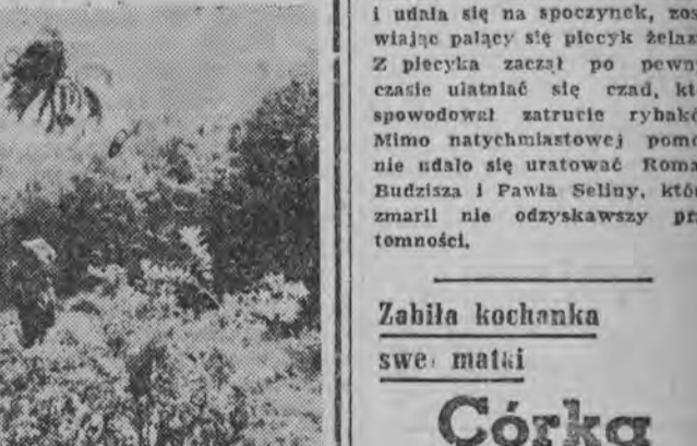
Jedna z grup rewolucjonistów patroluje w okolicy Las Villas.