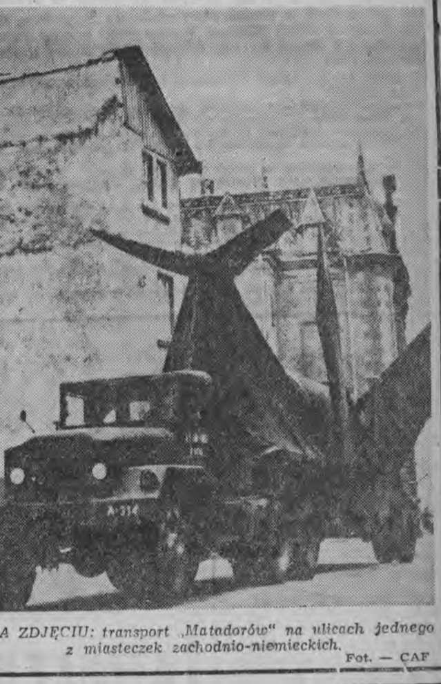
NA ZDJĘCIU: transport „Matadorów” na ulicach jednego z miasteczek zachodnio-niemieckich.