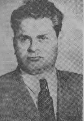
J. Kuźmin — zastępca przewodniczącego Rady Ministrów ZSRR, przewodniczący Państwowej Komisji Planowania ZSRR.