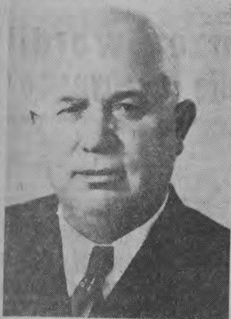
N. S. Chruszczow — przewodniczący Rady Ministrów ZSRR.