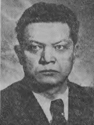
A. Zasiadko — zastępca przewodniczącego Rady Ministrów ZSRR.