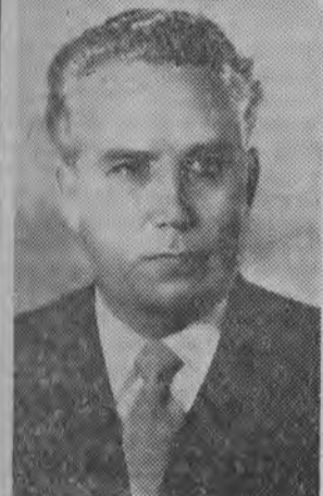
P. Kozłow — pierwszy zastępca przewodniczącego Rady Ministrów ZSRR.