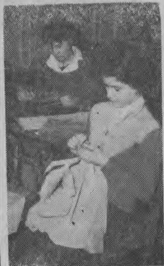
NA ZDJĘCIU: ćwiczenia praktyczne. CAF — fot. GHI