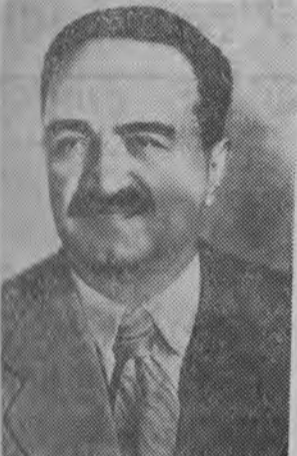
A. Mikołaj — pierwszy zastępca przewodniczącego Rady Ministrów ZSRR.