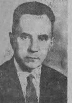
A. Kosygin — zastępca przewodniczącego Rady Ministrów ZSRR.