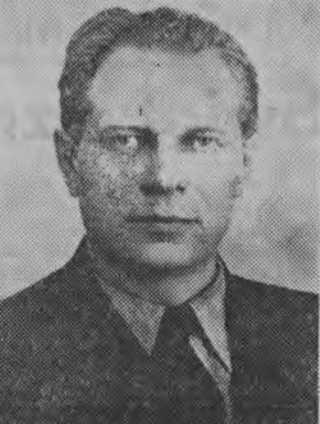
D. Ustinow — zastępca przewodniczącego Rady Ministrów ZSRR.