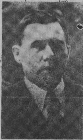
Minister A. Gromyko.

N. Bułganin został prezesem Banku Państwowego ZSRR.