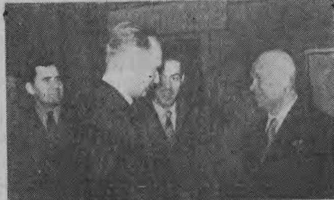
NA ZDJĘCIU: D. Hammarskjöld u I sekretarza KC KPZR N. Chruszczowa. W rozmowie wziął udział minister spraw zagranicznych A. Gromyko (z lewej).

Warto zaznaczyć, że w najbliższym czasie WFM rozpocznie produkcję skuterców.