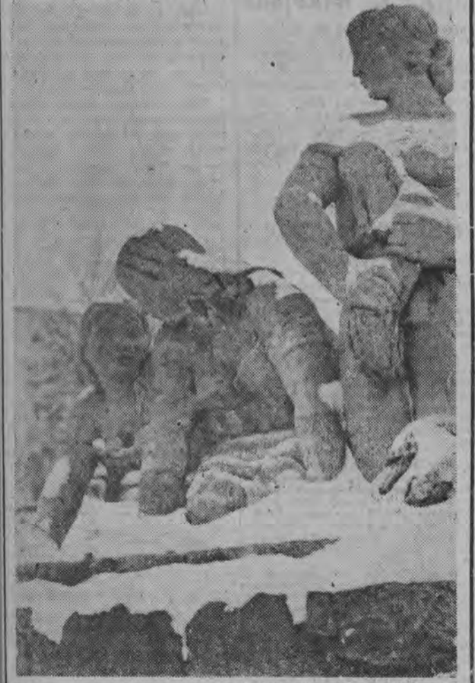
Jeszcze do niedawna tak wyładowały popularne białostockie praczkki.