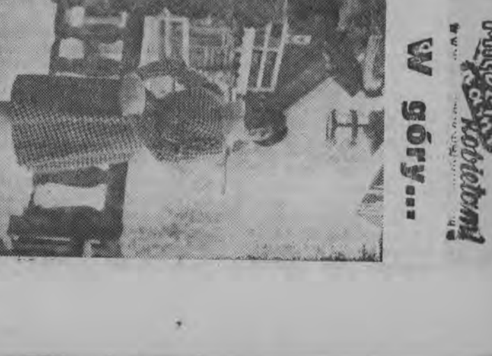
Elegancka sukienka w modną dużą pejpie ozdobioną baranizem. Worek CAF