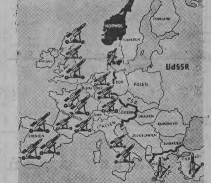
Plan rozmieszczenia amerykańskich wyrzutni raketowych w Europie.

Wschodu i Zachodu. Należało też zająć się nieoczekiwanymi punktami obrad jak: zagadnieniem zaprzestania prób z bronią jądrową na okres 2—3 lat, projektem zawarcia paktu o nieagresji między państwami NATO a członkami Układu Warszawskiego, wysuniętem przez Macmillana oraz propozycję Rakola amerykańskie były