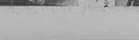
I male tamy ubierają się modnie.

Melancholia Znamiatując po jednej literze przejęć w pierwszym wypadku wyrazu kosa, zaś w drugim wypadku z wyrazu para do wyrazu tora. Rozwiązania zadania nr 23 nadesłali naley na adres redakcji, z dopiskiem na kopercie: „rozwiązanie” do dnia 29 bm. Wśród Czytelników, którzy prawidłowo rozwiązali zadanie rozdostawnych zostanie 5 nagrał książkowych.