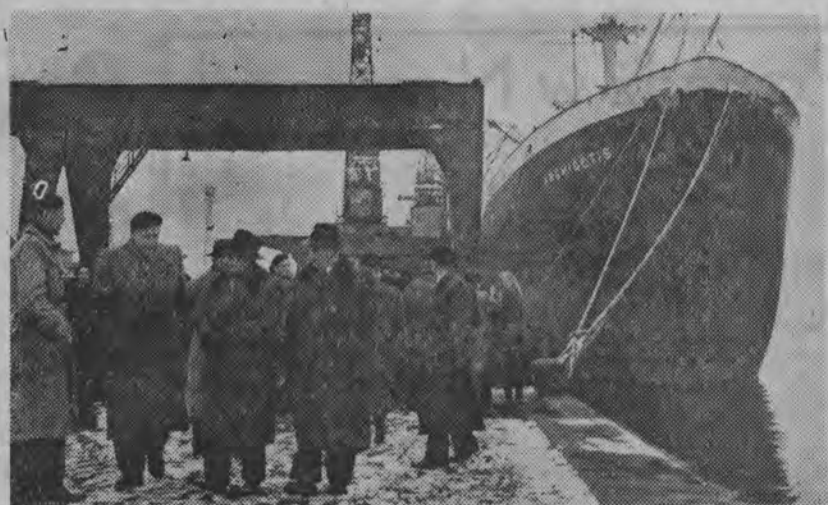
Delegacja czechosłowackiego Zgromadzenia Narodowego wzięła udział w uroczystościach wodowania pierwszego, wybudowanego przez Stocznię Szczecińską, statku motorowego o tonażu 6 tys. DWT „Krynicy”. NA ZDJĘCIU: delegacja parlamentarzystów CSR zwiedza port szczeciński.

Rozwój gospodarki ZSRR po XX Zjeździe KPZR • Perspektywy dalszego rozwoju nauki i techniki radzieckiej • Przygotowania do konferencji na najwyższym szczeblu • Stosunki między partiami robotniczymi i komunistycznymi • Perspektywy rozwoju współpracy międzynarodowej • Nowe momenty w rozwoju stosunków przyjaźni między ZSRR i Polska