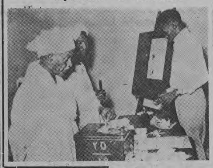
NA ZDJĘCIU: wyborca składa swój głos do urny.

Z prawej strony na tablicy biuletyn wyborczy przypominający, iż głosuje się na symbole kandydatów, w tym wypadku na dzidę, cedr, lub lwa.