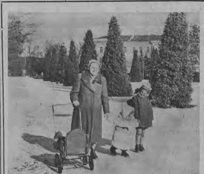
Na plantach. Słoneczna pogoda sprawiła, że coraz częściej mamusi spotkać można na spacerze w parku łódzkiej mieszkańców naszego miasta.

W drugim kwartale br. Wytwórnia Sklejek Spółdzielni Pracy „Tartak” zaopatrzona zostanie w prasę hydrauliczną oraz suszarkę rolkowa do suszenia łuszczy. Pozwoli to na rozpoczęcie produkcji sklejek klejonej na sucho używanej do wyrobu mebli.