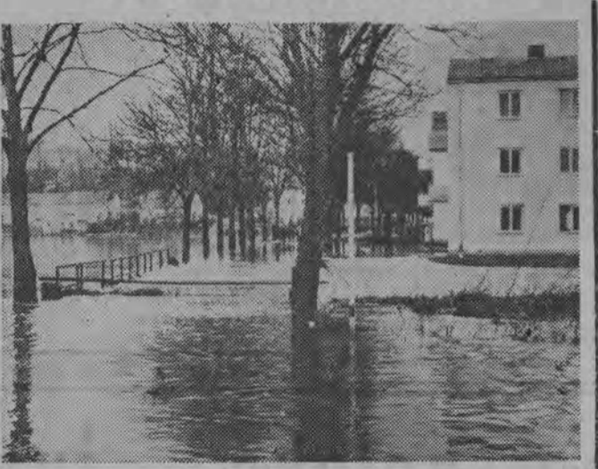
NA ZDJECIU: Zwieterbrücken. Woda zalała częściowo zabudowę w ubiegłym roku osiedle zamieszkałe przez ok. 1000 osób.