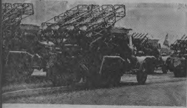
Wielkiej defilady broni rakietowej na Placu Czerwonym w Moskwie w dniu 7 listopada 1957 r. Wzrost z 40 Rocznicą powstania Armii Radzieckiej zamieścimy na str. 2 fragmenty artykułu marszałka I. Bagramina pt. „Bojowy szlak Armii Radzieckiej”.

Proletariusze wszystkich krajów, łączcie się!