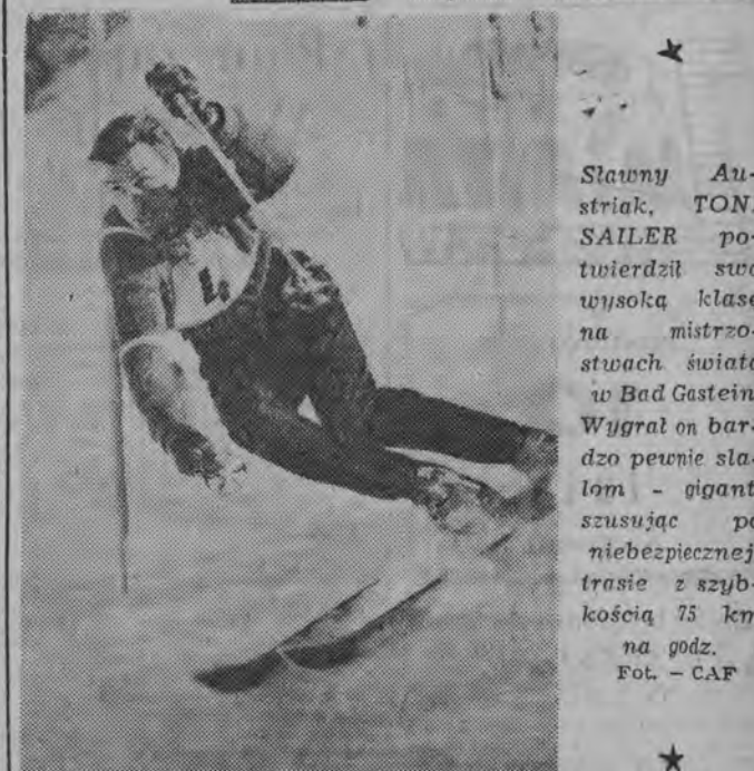
Sławny Austriak, TONI SAILER, potwierdził swą wysoką klasę na mistrzostwach świata w Bad Gastein. Wygrał on bardzo pewnie slalom - gigant, szusując po niebezpiecznej trasie z szybkością 75 km na godz.