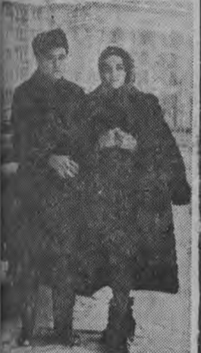
NA ZDJĘCIU: znany reżyser filmowy Mike Todd i jego żona Elisabeth Taylor w pobliżu hotelu „Moskwa”.

Według najświeższych danych, które otrzymaliśmy w godzinach nocnych, frekwencja wyborcza w poszczególnych województwach przedstawiała się następująco (dane do godziny 19.00):