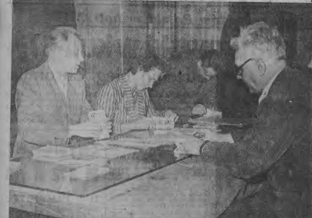
Komisja wyborcza przy WZPW oblicza głosy.