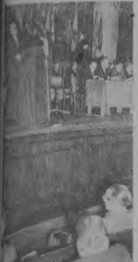
NA ZDJĘCIU: do uczestników Zjazdu przemawia I sekretarz KC PZPR Władysław Gomułka.

Na str. 3 zamieszczamy wyczerpujący referat, wygłoszony przez przewodniczącego CK SD Stanisława Kulickiego w pierwszym dniu Zjazdu.