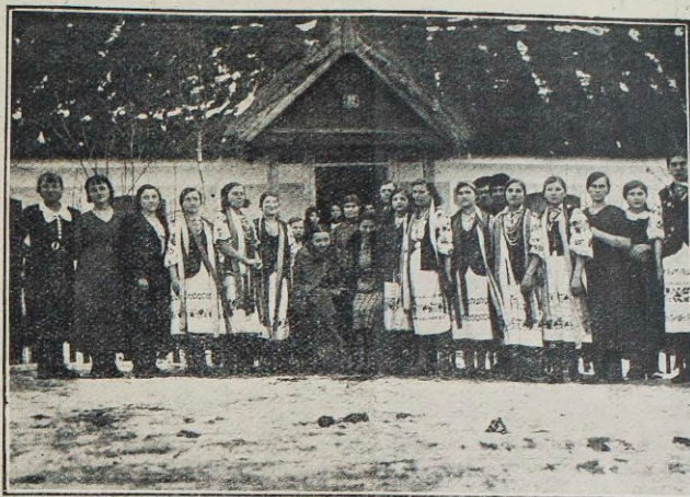
Kurs kroju i szycia w KMW Moszków, pow. Dubno.

W ciągu kilku lat stosowania w naszej Organizacji konkursów dobrego czytania, mimo że nieraz trudno osiągnąć równe i jednakowo wzrastające rezultaty tej pracy, w okresie sprawozdawczym, z powodu niedociągnięć organizacyjnych PZMW, ilość zespołów, które pracę ukończyły, jest za mała, nie mniej jednak stwierdzić należy znaczny wzrost ilościowy zespołów i osób w porównaniu z rokiem ubiegłym. I tak — gdy w roku ub. zakończyło pracę 115 zespołów z 627 uczestnikami, to obecnie liczba zespołów wzrosła do 142 z 852 uczestnikami, w czym zespołów I grupy—77, II grupy—45 i III—20 zespołów. Jeśli chodzi o konferencje przodowników zespołów konk. dobrego czytania, to znów należy stwierdzić, że zaledwie część powiatów w roku sprawozdawczym je organizowała. Konferencje poświęcone tylko konkursom przeprowadziły powiaty: Dubno 2-dniową, w której wzięło udział 28 uczestników; Równe 3 konferencje, na których było ogółem 46 osób, oraz Włodzimierz 3-dniową z 19 uczestnikami. Inne powiaty, a mianowicie: Krzemieniec, Łuck, Sarny powiązały sprawy konkursów z innymi zagadnieniami oświatowymi; powiat horochowski zorganizował 4-dniowy kurs bibliotekarski.