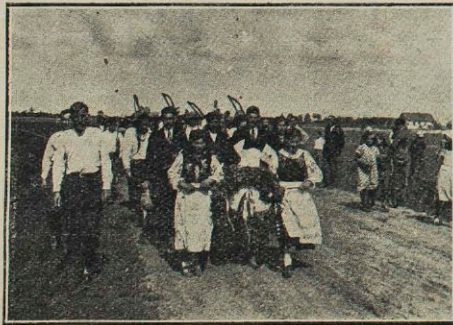
Z dożynek powiatowych w Kostopolu.

Rok sprawozdawczy charakteryzuje się dużym wzrostem udziału naszych członków w organizacjach starszego społeczeństwa. Stwierdzamy ściśle współdziałanie z nami Wojewódzkiego Towarzystwa Organizacji i Kółek Rolniczych, Wojewódzkiej Organizacji Kół Gospodyń Wiejskich i Spółdzielczości. Powiązanie prac wszystkich organizacji społecznych wiejskich z Wołyńską Izłą Rolniczą dopełnia całości normalnego działania zorganizowanej wsi