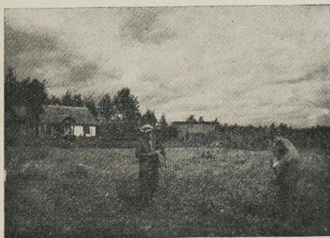
Na konkursowej łączce.

Wczytując się w powyższą tabelę, stwierdzamy pokaźny wzrost osób, zespołów i Kół w porównaniu z rokiem poprzednim, oraz z rokiem 1936, w którym rozpoczęło prace 2.335 osób w 269 zespołach i 195 Kółach. Już z przytoczonych z ostatniego trzylecia cyfr widać stały i systematyczny rozwój akcji p. r. w naszym Związku; rozwój ten miał miejsce i w latach poprzednich — jest więc zjawiskiem stałym. W ostatnich latach tempo tego rozwoju uległo nawet przyspieszeniu. Jeśli jednak weźmiemy pod uwagę pierwsze dwie kolumny w powyższym zestawieniu, przedstawiające ilości Kół w powiatach i ilości Kół prowadzących p. r., to spostrzeżemy, że w większości powiatów Wołynia zaledwie połowa Kół tę pracę prowadzi. Nie jest to zjawisko pożądane.