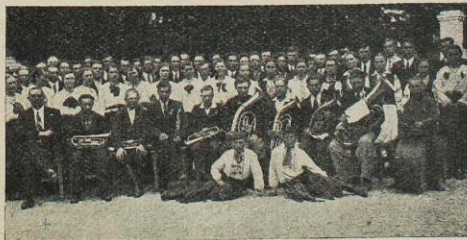
Orkiestra KMW na Zjeździe Pow. w Dubnie.