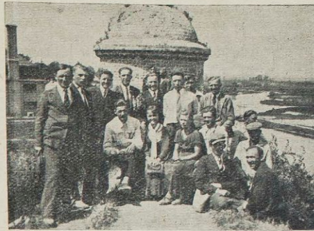
Wycieczka członków KMW na zamku w Dubnie.

Teatr i pieśń, zwłaszcza chóralnie śpiewana, są dla młodzieży wołyńskiej najbardziej naturalnymi i bezpośrednimi formami wyrażania umiłowań i porywów ducha. Zrozumiałe więc, że te treści kultury ludowej Wołynia znalazły wyraz w naszych pracach kulturalno-oświatowych. Rozumiemy wszyscy dobrze znaczenie wychowawcze chóru i teatru, — rozumiemy, że teatr i chór posiadają ogromny wpływ na kształtowanie charakteru i duszy. Piękno bowiem melodii i słowa w powiązaniu z przeżyciem ludzi na tle sceny teatralnej doskonali człowieka, podnosi go ku głębszym odczuwaniom, ku lepszemu, piękniejszemu i jaśniejszemu pojmowaniu życia. I to działanie nie ogranicza się jeno do tych, którzy biorą udział np. w przedstawieniu, ale rozszerza swój wpływ znacznie dalej, na całe środowisko,