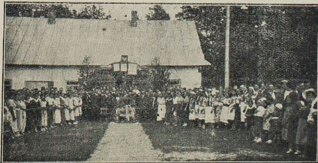
Uroczystość dwudziestolecia KMW w Perespie, pow. Sarny.

Zastanawialiśmy się przez chwilę nad naszą przeszłością choćby dlatego, że rok sprawozdawczy, dorobek którego chcemy rozważać,