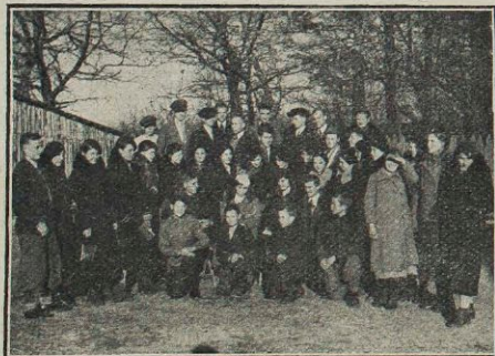
Kurs p. r. w Kostopolu.

Stan ilościowy akcji p. r. W jesieni roku ubiego prace p. r. zakończyło 1505 osób w 233 zespołach ze 189 Kół Młodzieży Wiejskiej. Stan ten w porównaniu z rokiem poprzednim (1936), w którym zakończyło 1446 osób w 210 zespołach i 158 Kółach, — wykazuje pokaźny wzrost ilości Kół, kończących pracę. Ilość Kół, które jesienią zgłosiły się do pracy na rok 1938 wynosiła 312 zaś ilość osób 4391, w 463 zespołach. Ilość ta w porównaniu ze stanem zakończenia oraz z analogicznym okresem roku poprzedniego wykazywała olbrzymi wzrost. Niestety, jednak po okresie prac samokształceniowych w zimie, do zajęć praktycznych w konkursach uprawy i wychowu przystą-