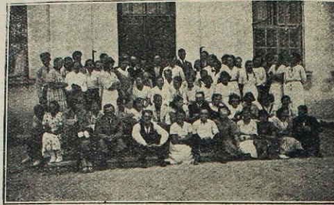
Zjazd wychowanków U. L. w Różanie.

Należy stwierdzić, że okres sprawozdawczy charakteryzował się dużą różnorodnością prac. Poza normalnie prowadzonymi pracami rozpoczęliśmy przepracowanie zagadnienia młodocianych, zajęliśmy się przysposobieniem samorządowym i wychowaniem fizycznym. Na odcinku organizacyjnym stwierdzamy dalszy wzrost ilości nowoorganizowanych Kół Młodzieży Wiejskiej, zwiększenie ilości kandydatów i koleżanek w Kołach; w pracach oświatowych posunęliśmy się naprzód w czytelnictwie książek i pism, zwiększyła się ilość bibliotek kołowych; konkurs dobrego czytania książki w po-