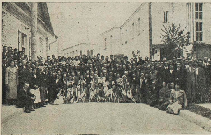
Zjazd Powiatowy w Lucku.

Podstawową komórką organizacyjną jest Koło Młodzieży Wiejskiej, którego sprężystość