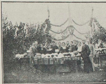
Fragm. wystawy p. r. w Kuszlinie

Przed dwoma laty rzucone zostało hasło: „nie ma Kół, w którym nie byłoby p. r.”. Hasło to zostało podjęte przez sporą ilość Kół i przyczyniło się do przyspieszenia tempa roz-