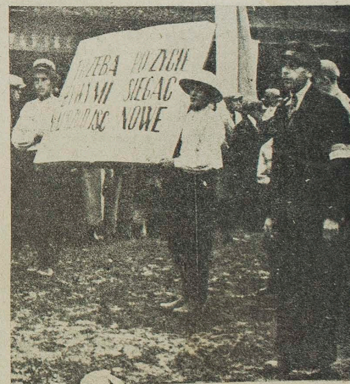
„Trzeba z żywymi naprzód iść, po życie sięgać nowe”.