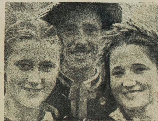
Z Siedleckiego uśmiechnięta trójka.

Передплата часописів Гуртками виглядає так: Р. Р. передплатувало 1548, інших господарських—2326 Гуртків. З інших праць треба навести, що висаджено Гуртками 16274 деревець, впорядковано 1329 подвір. Пороблено перші кроки в справі будови власного