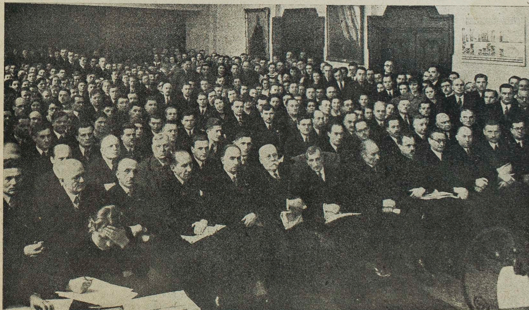
Zjazd Centralnego Związku Młodej Wsi w Warszawie.

Але значіння нинішнього дня додачу не лише в такому об'єднанні двох сердець близьких організацій селянської молоді, що не від сьогодні працюють з переконанням про передову свою роль у великому процесі усамостійнення й дозрі-