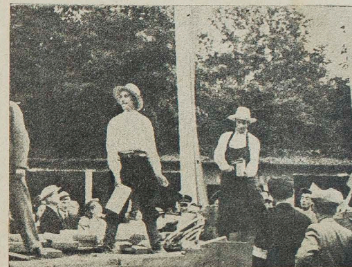
Budujemy Dom Ludowy.

Центральний З'їзд Ц. С. М. С. закликає Головну Управу: 1) видати фахово-господарчий порадиш, 2) зорганізувати 500 кружків для кореспонденційних кооперативних курсів „Sprotem”, 3) зорганізувати 500 кружків для кореспонденційних курсів Рільничих і Зарібково-Господарських Кооператив.