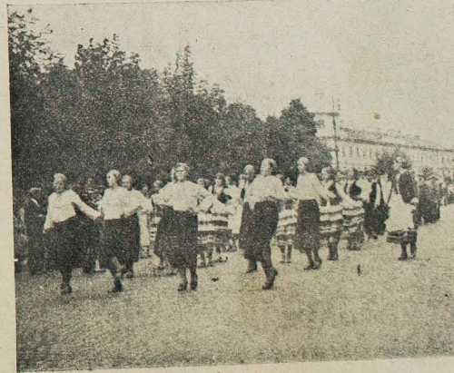
„Majdaniak” z Zamojskiego.