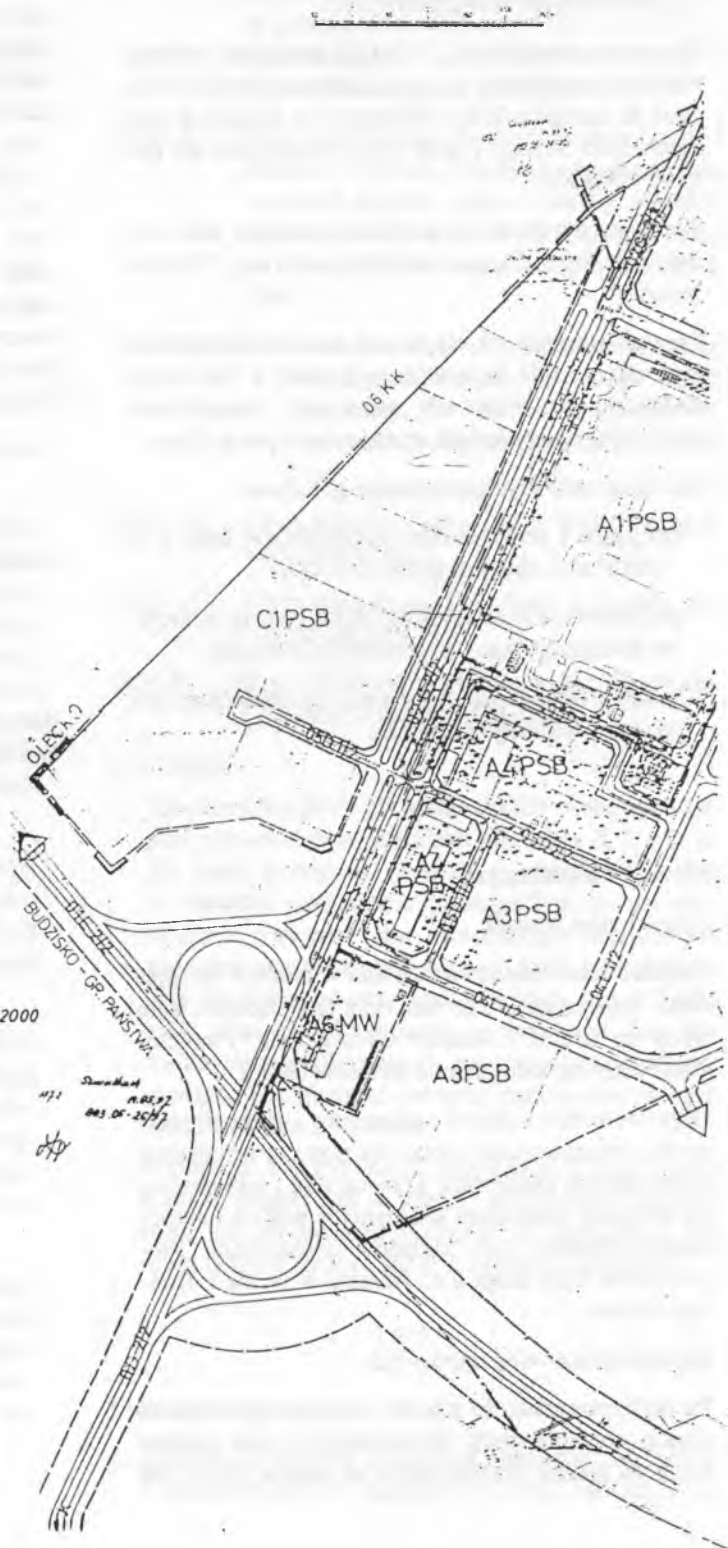
MAPA SYTUACYJNO-WYSOKOŚCIOWA SKALA 1:2000 Obiekt: m. SUWAŁKI

MAPA SYTUACYJNO-WYSOKOŚCIOWA... WYKONANA W 1997 ROKU... AUTOR: [signature]