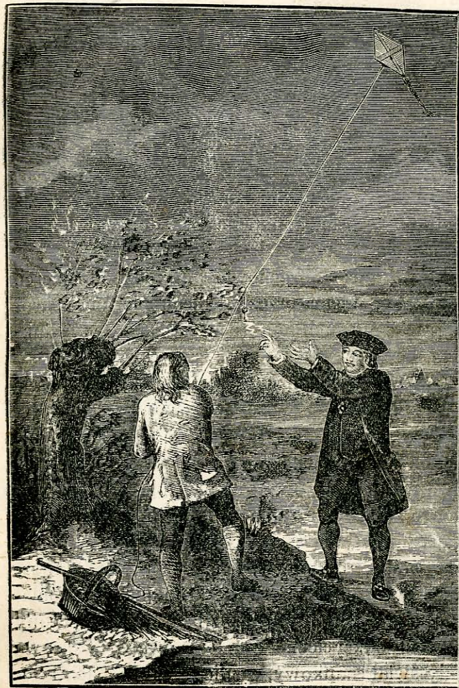
Franklin przybliży palec do klucza i otrzymuje bolesne uderzenie.

Genialne przypuszczenie zmieniło się w pewnik; tożsamość elektryczności i piorunu została dowiedziona! Na zasadzie tego doświadczenia