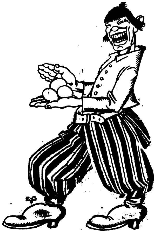
Abó to my, wiościanio, nie płacim podatków? Przysłanem właśnie podatek grontowy. oo gę zabrakim z całej wali!

To też gniew jego może się wreszcie zwrócić przeciwko sprawcom jego klęsk, przeciwko szakalom, szarpiącym jego żywe ciało kłami, umazanemi krwią poprzednich ofiar.