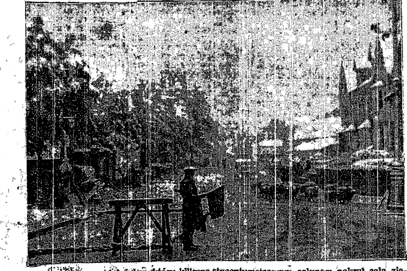
W Anglii spadł onegdaj śnieg, który kilkoma stucentymetrowym całunem pokrył całą ziemię. Na zdjęciu miasto Barnstaple (Devon)