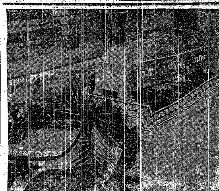
TRUMNA MARSZAŁKA PIŁSUDSKIEGO SPOCZYŁA W GROBACH KRÓLEWSKICH NA WAWELU

nieznanej kobiecie, o sercu czystym, tak gorącym i tak polskiem”.