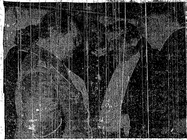
Rozmowa premiera Goeringa z ministrem Lavallem po uroczystościach pogrzebowych w Krakowie.