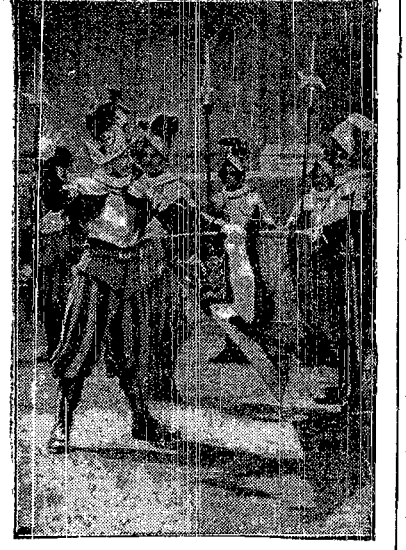
W obecności kardynała sekretarza Stanu za przysiężono w Watykanie nowych żołnierzy gwardji szwajcarskiej Ojca św.