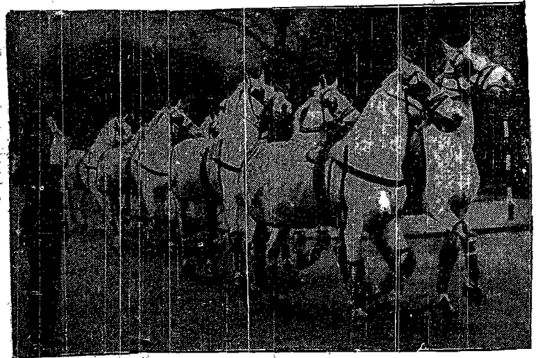
Do Londynu przybył zaprzęg osmna siewozów, które będą ciągnęły karocę królewską podczas jubileuszu.