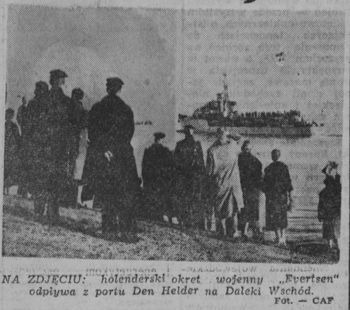
NA ZDJĘCIU: holenderski okręt wojenny "Evertsen" odpływa z portu Den Helder na Daleki Wschód.