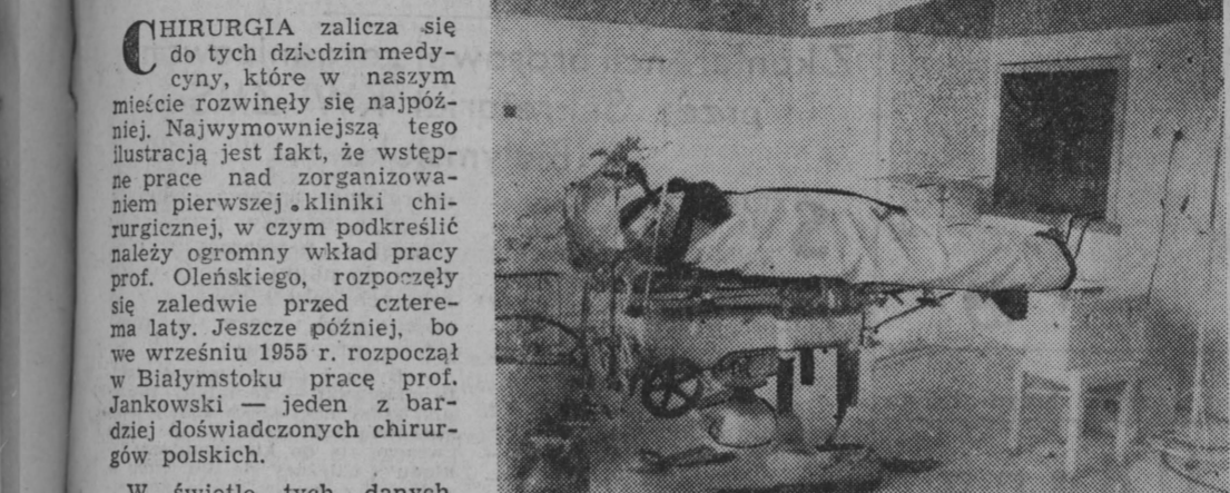
Przygotowanie do operacji w warunkach hipotermicznych. Chory znajduje się w skafandrze, obniżającym temperaturę ciała do 25 st. C.