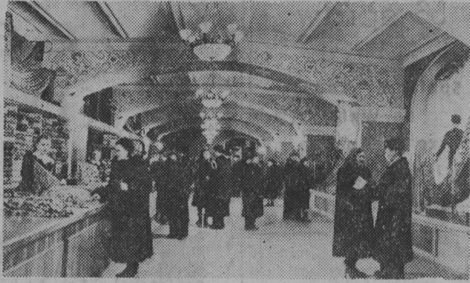
NA ZDJĘCIU: w Państwowym Domu Towarowym na Placu Czerwonym w Moskwie w dziale sprzedaży materiałów jedwabnych