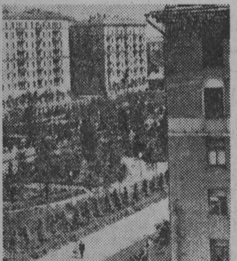
NA ZDJĘCIU: ulica Nowo-Pięszczana w Moskwie.

kilku lat pt. „Miasta i lata”, pisze o rodowodzie dzisiejszej nauki radzieckiej: „Idea zorganizowania uczonych w ścisły, jednolity kolektyw w celu swobodnej uniwersalnej współpracy była wysunięta przez Włodzimierza Iljicza Lenina. W ogniu wojny domowej, kiedy naród radziecki ponosił ciężkie ofiary i niezłomnie walczył o swą niezależność, Lenin uczynił dla nauki wszystko, by ratować ją dla przyszłości, wciągając do tej szlachetnej „Prawy M. Gorkiego. Pamiętamy nie tylko walkę wielkiego pisarza o poprawę bytu uczonych w okresie wielkiej nędzy, zniszczeń i głodu,