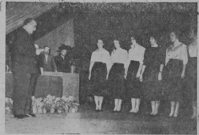
NA ZDJĘCIU: studentki I roku składają w imieniu swych kolegów uroczyste ślubowanie.

Inauguracyjne uroczystości na trzech uczelniach Białegostoku