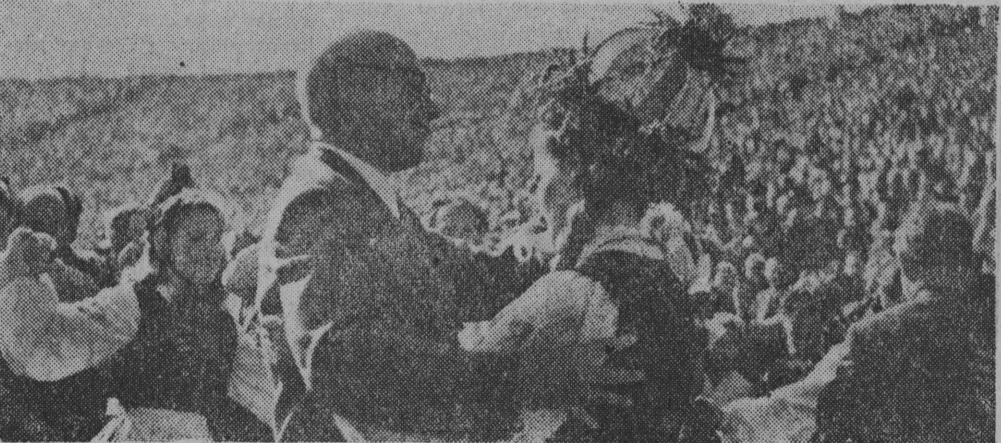
NA ZDJĘCIU: gospodarz Dożynek i sekretarz KC PZPR Władysław Gomułka w tańcu z przodownicą Dożynek (fotoreportaż z dożynek — na str. 4).

DZIS rano lokalne mgły, od zachodu przejściowy wzrost zachmurzenia, później przejściwna. Temperatura maksymalna od 17 do 23 stopni. Wiatry słabe południowo-zachodnie. JUTRO nadal ciepło.