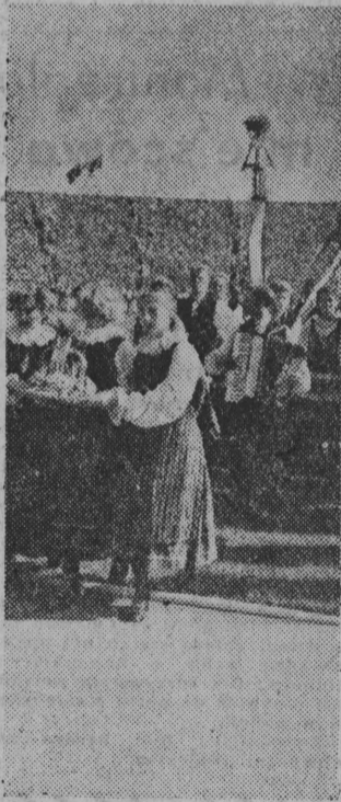
NA ZDJĘCIU: grupa w wój. białostockiego z wieńcem dożynkowym.