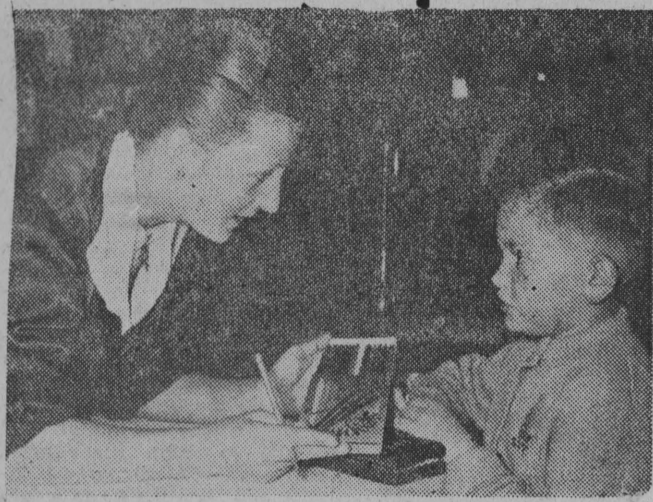
Dziś szkoły w całym kraju zapelnia się ponownie młodzieżą. Jak zawsze — wiele kłopotów mają rodzice i sprzedawcy w sklepach z artykułami szkolnymi. Jak zawsze — tak i w tym roku — potrzebne przedmioty kupuje się w ostatniej chwili.

I znowu zaczynamy rok szkolny, i znowu zastanawiamy się, co zrobić, jak ułożyć wszystkie sprawy, żeby lepiej wychowywać nasze dzieci. A kłopotów z dziećmi mamy co niemiara. Mamy mało pieniędzy i nie wszyscy możemy dzieci dobrze ubrać. Mamy ciasne mieszkania i czasem rzeczywistość trudno jest dzieciom wydzielić taki kąt, by im zapewnić dobre warunki do odrabiania lekcji. W szkołach jest niezwykle ciasno i część dzieci musi chodzić na drugą, a nawet na trzecią zmianę, co jest znowu trudne do pogodzenia z naszymi godzinami pracy, godzinami posiłków rodziny, co w domu i w szkole stwarza dziecku gorsze warunki.