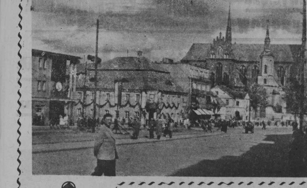
NA ZDJĘCIU: fragment Rynek Kościuski od strony Domu Towarowego.