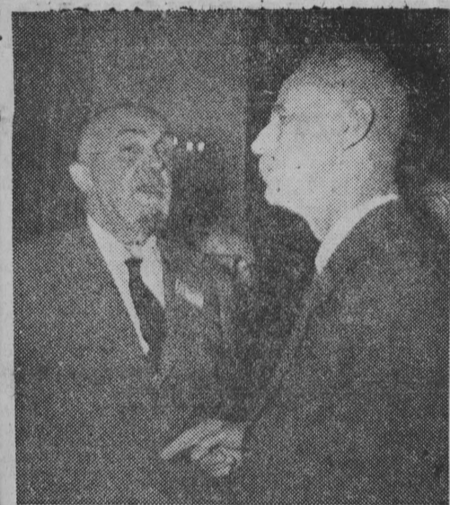
NA ZDJĘCIU: w przerwie obrad. Prof. Tadeusz Kotarbiński w rozmowie z prof. Gastonem Bergerem (Francja).