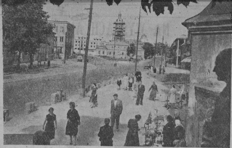
Fragment białostockiego Rynku Kościuszki w porannym słońcu.