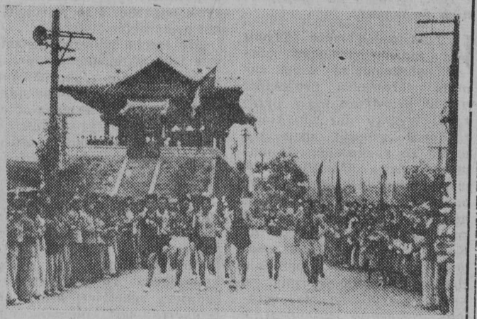
NA ZDJĘCIU: start sztafety koreańskiej młodzieży. Sztafeta przybędzie 450 km i przekroczy 64 rzeki koreańskie. Potem paterczkę przejmą młodzi Chińczycy.