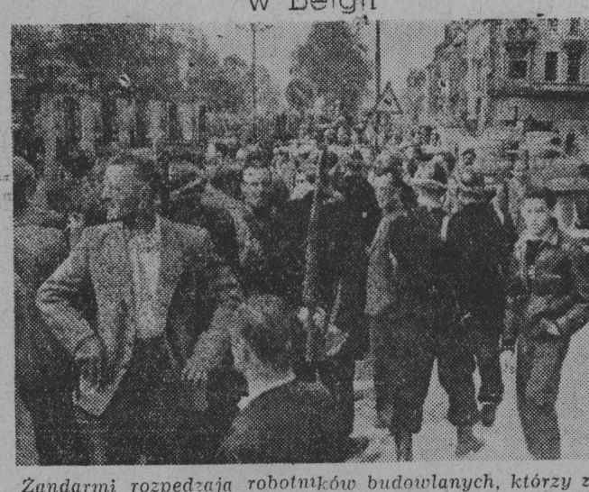
Zandami rozpędzają robotników budowlanych, którzy zajęli tunel Porte Louise.