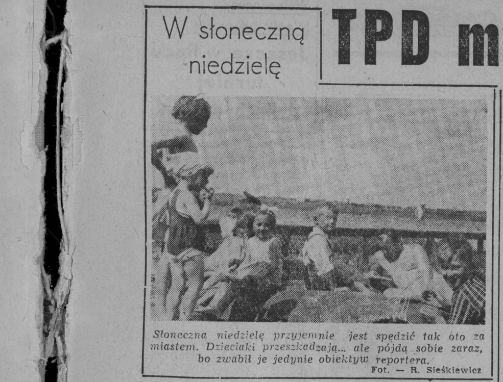
W słoneczną niedzielę

„Czyżby nie rozumieli tego nasi działacze i aktywiści?”