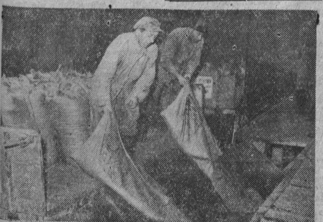
CAF — fot. Pleńkowski