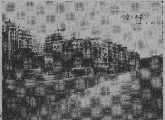
NA ZDJĘCIU: bulwar nadmorski w Aleksandrii. Na prawo — niewidoczne na zdjęciu — Porto Grande.

(Artykuł z okazji święta narodowego Egiptu pt. „Dzień Niepodległości i Republiki” — czytaj na str. 2).