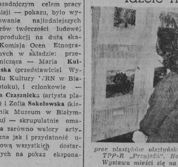
Prac plastyczne artystów, zorganizowaną przez Klub TPP-R „Przyjaźń”