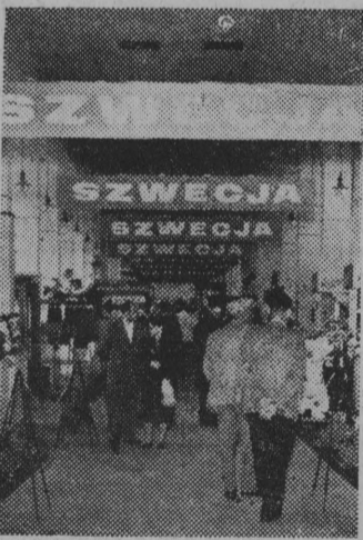
W pawilonie Szwecji.

Sz szczególnie godną podkreślenia jest transakcja zawarta z norweskimi kupcami branży odzieżowej. Zakupili oni koszule męskie, suknie,