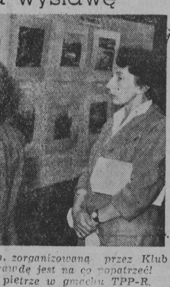
Prac plastyczne artystów, zorganizowaną przez Klub TPP-R „Przyjaźń”