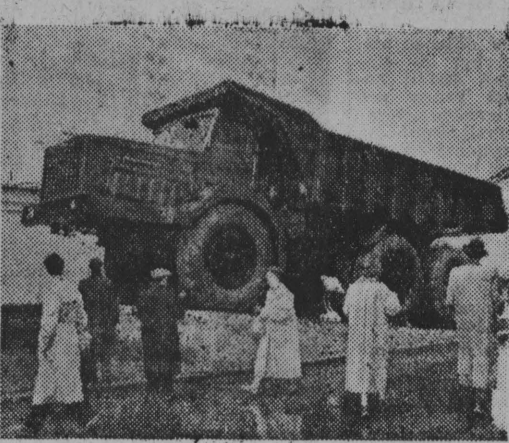
NA ZDJĘCIU: trójosowy samochód ciężarowy - wyprodukowany 40 ton produkcji Mińskiej Fabryki Samochodów.