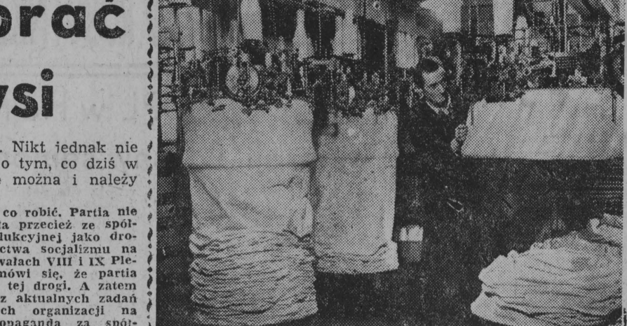
NA ZDJĘCIU: produkcja tkanin jersyowych na specjalnych krosnach w firmie Rank & Co w Apolda.