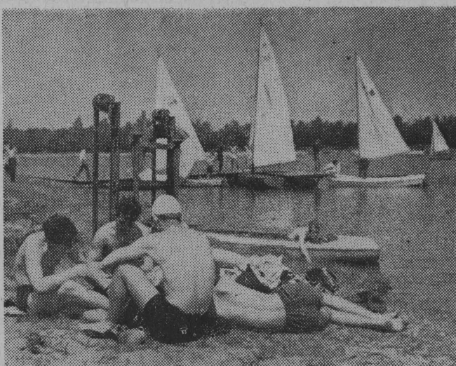
Pracownicy Zakładów Azotowych w Chorzowie korzystają z własnego ośrodka wczasów świątecznych, pięknie położonego nad jeziorem Pogoria k/Dąbrowy Górniczej. NA ZDJĘCIU: w przystani ośrodka...