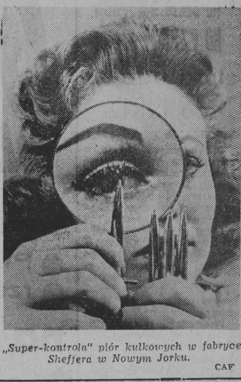
"Super-kontrola" niórkulkowych w fabryce Sheffera w Nowym Jorku. CAF