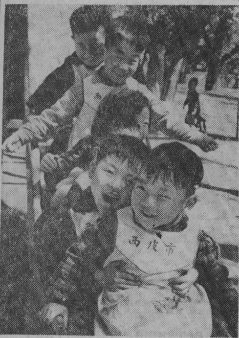
Uśmiech dziecka chińskiego...

DZIS W NUMERZE Przesłanki dalszej poprawy bytu — str. 3 Wstydzmy się zółwiego tempa — str. 3 Ciekawostki ze świata — str. 6